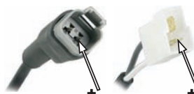
Deutsch DT 2-pin cap